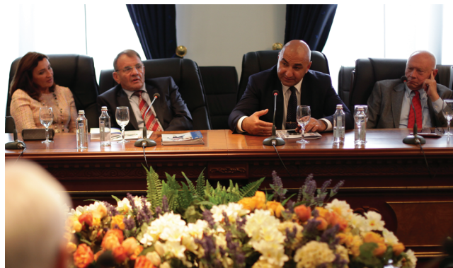
Участники XIX международного научного конгресса «Олимпийский спорт и спорт для всех». Ереван, 2015 г.