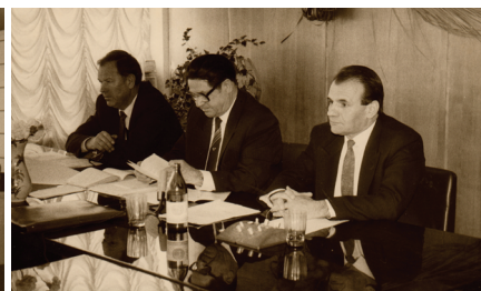
Первый международный научный конгресс «Современный олимпийский спорт». Киев, 1993 г.