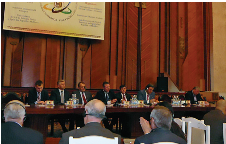
XV международный научный конгресс «Олимпийский спорт и спорт для всех». Кишинев, 2011 г.