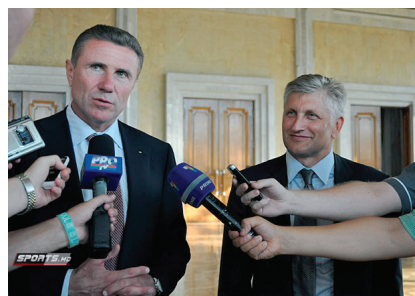
Президент НОК Украины Сергей Бубка на XV международном научном конгрессе «Олимпийский спорт и спорт для всех». Государственный университет физического воспитания и спорта Республики Молдова. Кишинев, 2011 г.