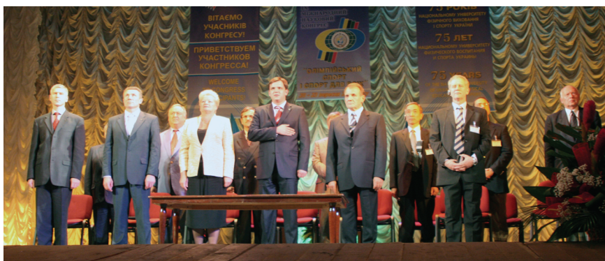
Торжественное открытие IX международного научного конгресса «Олимпийский спорт и спорт для всех». Национальный университет физического воспитания и спорта Украины. Киев, 2005 г.