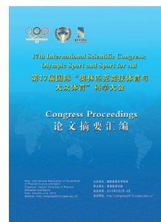
Программа XVII международного научного конгресса «Олимпийский спорт и спорт для всех» в Столичном университете физического воспитания и спорта. Пекин, 2013 г.