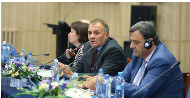
XVIII международный научный конгресс «Олимпийский спорт и спорт для всех» в Казахской академии спорта и туризма, посвященный XXVIII Всемирной зимней Универсиаде 2017 г. и 70-летию академии. Алматы, 2014 г.