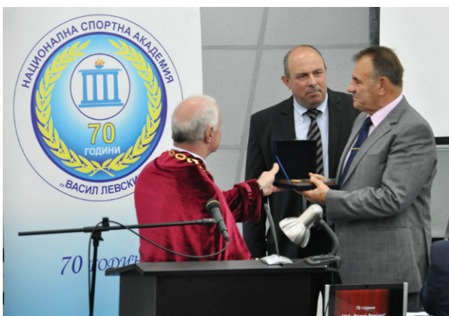
XVI международный научный конгресс «Олимпийский спорт и спорт для всех». Национальная академия спорта «Васил Левски». София, 2012 г.