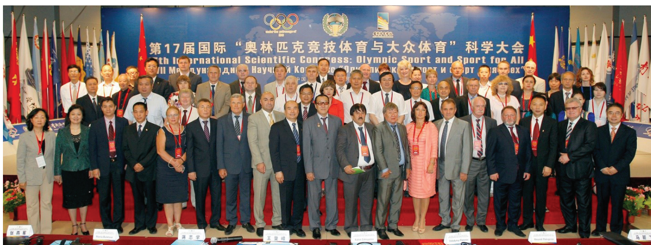
Участники XVII международного научного конгресса «Олимпийский спорт и спорт для всех» в Столичном университете физического воспитания и спорта. Пекин, 2013 г.