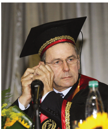
Восьмой президент Международного олимпийского комитета Жак Рогге – почетный доктор Национального университета физического воспитания и спорта Украины. 2006 г.