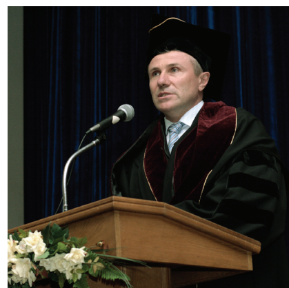
Член исполкома Международного олимпийского комитета, президент Национального олимпийского комитета Украины, олимпийский чемпион Сергей Бубка – почетный доктор Национального университета физического воспитания и спорта Украины. 2009 г.

Немало докладов было посвящено таким направлениям, как здоровый образ жизни и двигательная активность различных групп