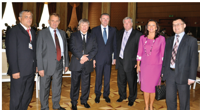
Делегация Украины среди участников XV международного научного конгресса «Олимпийский спорт и спорт для всех». Кишинев, 2011 г.