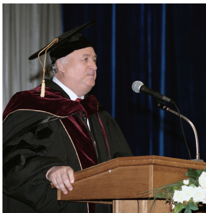
Член Международного олимпийского комитета, двукратный олимпийский чемпион Валерий Борзов – почетный доктор Национального университета физического воспитания и спорта Украины. 2009 г.

грузкам, методики развития двигательных (физических) качеств спортсменов (их скоростных и силовых способностей, гибкости, выносливости, координации), технико-тактическая и психологическая составляющие подготовки и соревновательной деятельности спортсменов, контроль и управление в системе подготовки спортсменов, место и роль спортсменов в олимпийском спорте и защита их интересов, специфика женско-