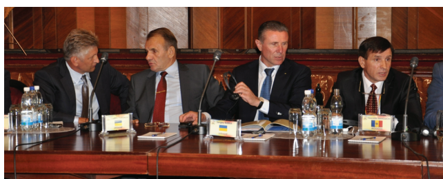
XV международный научный конгресс «Олимпийский спорт и спорт для всех». Кишинев, 2011 г.

Среди выступавших в разные годы с докладами на пленарных заседаниях конгрессов можно упомянуть таких видных