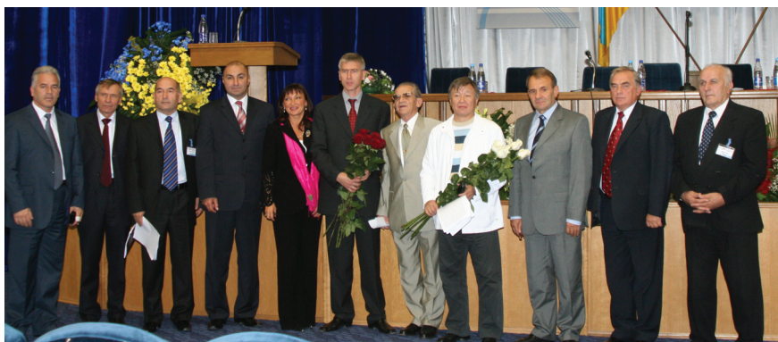
Участники IX международного научного конгресса «Олимпийский спорт и спорт для всех». Национальный университет физического воспитания и спорта Украины. Киев, 2005 г.