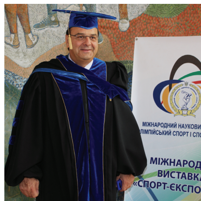
Президент Международной олимпийской академии Исидорос Кувелос – почетный доктор Национального университета физического воспитания и спорта Украины. 2010 г.