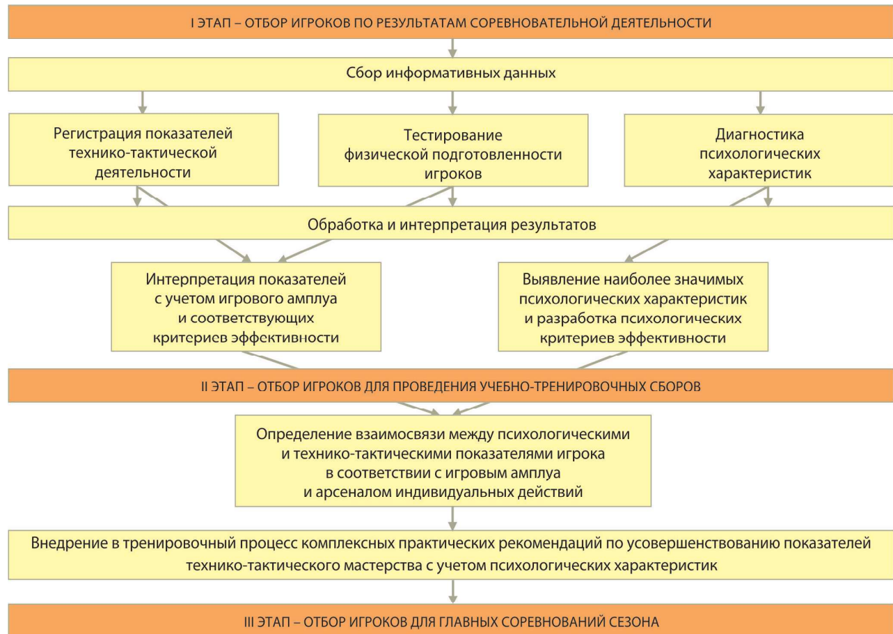
РИСУНОК 1 – Алгоритм комплексного отбора для сборных команд страны в игровых видах спорта