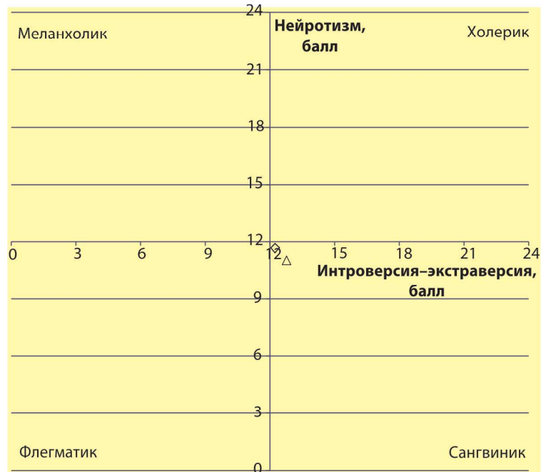
РИСУНОК 2 – Средние показатели типа темперамента членов сборных команд Украины по хоккею и баскетболу: △ – хоккей; ◇ – баскетбол

Для составления всесторонне обоснованной программы отбора в спортивных играх необходимо рассмотреть вопрос о преобладающем типе сенсорной