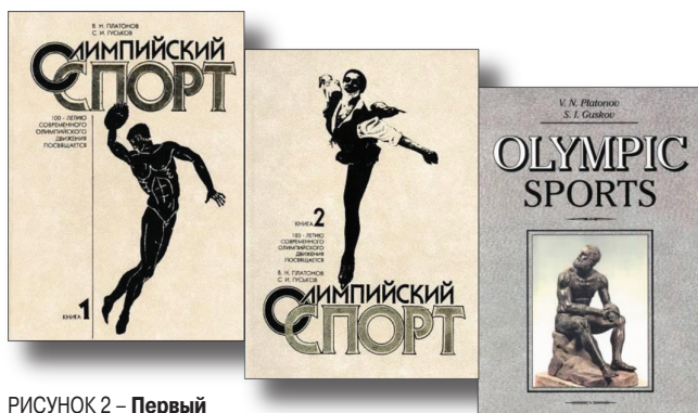
РИСУНОК 2 – Первый в мире учебник для высших учебных заведений «Олимпийский спорт»