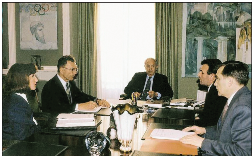
РИСУНОК 1 – Обсуждение в МОК стратегии олимпийского образования в Украине (1993 г.)

Реализация системы олимпийского образования в Украине осуществляется в двух относительно самостоятельных направлениях – общеобразовательном и специально образовательном, которое обеспечивает подготовку специалистов для разных звеньев сферы физической культуры и спорта: учителей и преподавателей физического воспита-