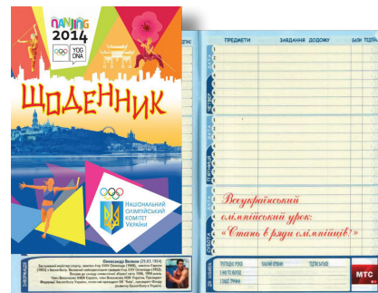
РИСУНОК 10 – Дневник, содержащий познавательную информацию об олимпийском движении