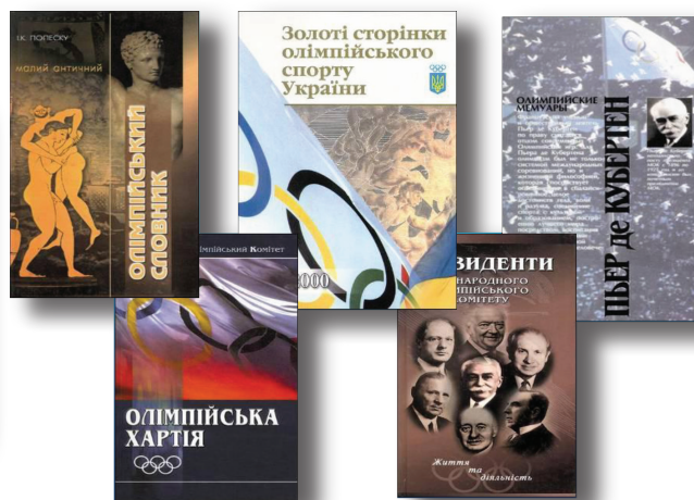
РИСУНОК 3 – Серия подарочных изданий по олимпийскому спорту

ния, тренеров по видам спорта, специалистов по спортивному менеджменту, рекреации.