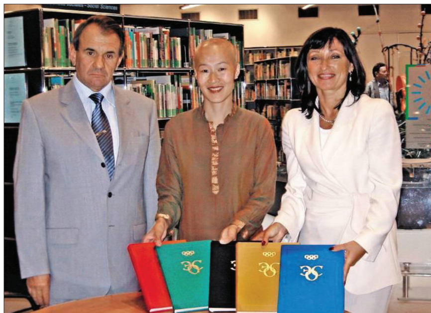
РИСУНОК 4 – Презентация пятитомника «Энциклопедия олимпийского спорта» в библиотеке Олимпийского музея, Лозанна, 2005 г.

своей деятельности выпустило более 150 книг, посвященных актуальным вопросам истории и становления олимпийского движения, его проблематике, вопросам повышения эффективности тренировочной и соревновательной деятельности спортсменов-олимпийцев, медико-биологическим и психологическим основам спортивной подготовки и др. Это – энциклопедии, учебники, учебно-методические пособия, монографии, научно-популярные и другие издания, представляющие интерес для специалистов сферы физического воспитания и спорта. Они представляют интерес не только для специалистов, но и для многих людей, интересующихся олимпийским спортом. Также в издательстве увидели