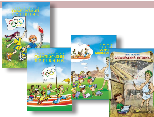
РИСУНОК 8 – Учебное пособие для учеников, учителей общеобразовательных школ, лицеев, гимназий и широкого круга читателей, интересующихся олимпийским спортом

Вторым важным направлением олимпийского образования в Украине является общеобразовательное. Его цель – пропагандировать среди подрастающего поколения олимпийские ценности, обогащая их знаниями об истории олимпийского движения от его зарождения до наших дней, развитии современного олимпийского спорта, Играх Олимпиад и зимних Олимпийских играх, основных идеалах и ценностях олимпизма, структуре МОК и его правовых основах, особенностях проведения олимпийских праздников, олимпийской символике и атрибутике, выдающихся личностях олимпийского движения. Это направление реализуется в детских дошкольных учреждениях, общеобразовательных учебных заведениях всех типов, профессионально-технических учи-