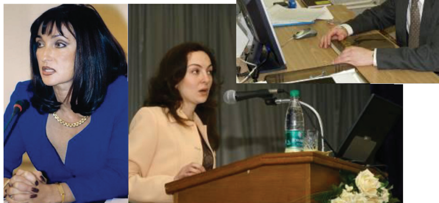
РИСУНОК 6 – В 2004 г. в НИИ НУФВСУ открылась лаборатория олимпийского образования