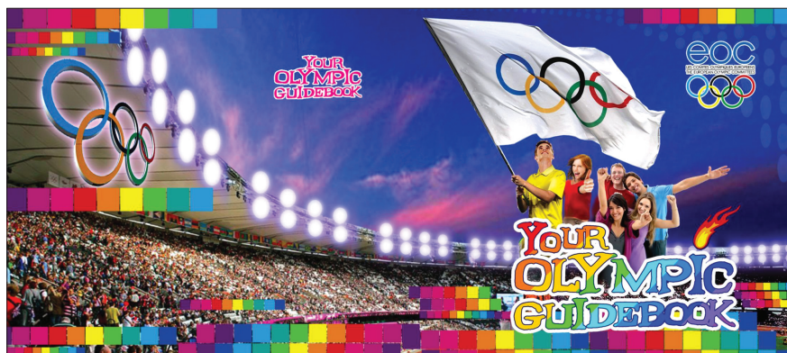
РИСУНОК 9 – Англиязычная версия учебного пособия «Твой олимпийский путеводитель»

В помощь учителям для улучшения методического обеспечения во время учебно-воспитательного процесса по олимпийскому образованию ОАУ был выпущен ряд учебников.