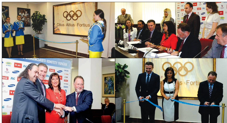
РИСУНОК 5 – Торжественное открытие Международного центра олимпийских исследований и олимпийского образования

Большая роль в проведении исследовательской работы принадлежит лаборатории олимпийского образования Научно-исследовательского института НУФВСУ, созданной в 2004 г. (рис. 6). В 2005–2010 гг. лабораторией совместно с Олимпийской академией Украины и Международным центром