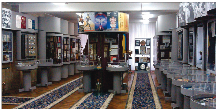
РИСУНОК 7 – Музей олимпийской славы Украины

Образовательная и научно-исследовательская деятельность президента Олимпийской академии Украины, заслуженного деятеля науки и техники Украины, лауреата Государственной премии Украины в области науки и техники профессора М. М. Булатовой отмечена наградами международного олимпийского сообщества: Международного олимпийского комитета – медаль Пьера де Кубертена (2009 г.), Международной олимпийской академии – «Афина» (2012 г.), награды Международного общества олимпийских историков (ISON) имени первого президента МОК Деметриуса Викеласа (2014 г.), а также трофеев президента МОК Томаса Баха (2015 г.). В 2015 г. М. М. Булатова была избрана в состав Комиссии МОК «Культура и олимпийское наследие».