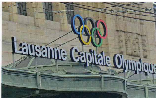
Железнодорожный вокзал Лозанны приветствует приезжающих в «Олимпийскую столицу»

вернулась на Игры уже под флагом Зимбабве.)