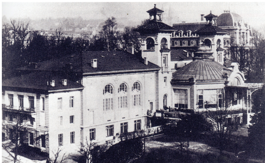
Казино де Монбенон было открыто в 1908 г., где впервые после Первой мировой войны собрался МОК. 6 апреля 1919 г. там состоялась 18-я сессия МОК. Роскошные помещения казино использовались для выставок, а также для офиса и Олимпийского института Лозанны, основанного Пьером де Кубертенем

Грабер, мэр Лозанны, побывал в 1952 г. на Играх в Хельсинки, которые произвели на него огромное впечатление. «Необыкновенная атмосфера, созданная энтузиазмом