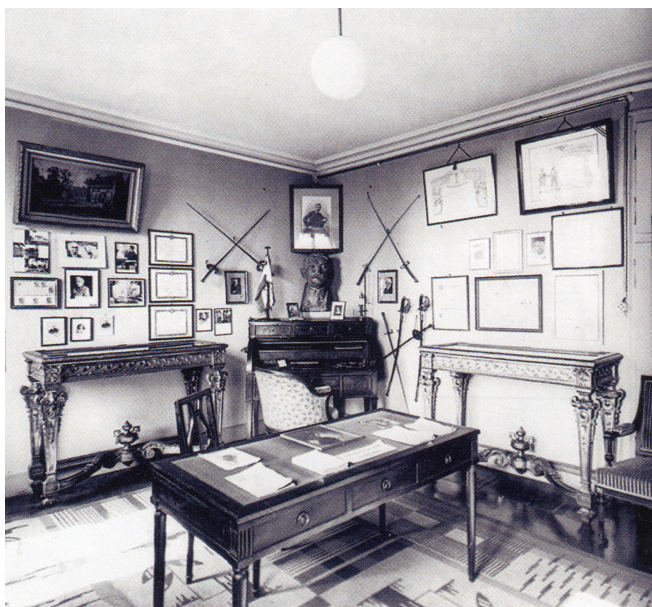
Олимпийский музей размещался в двух комнатах на первом этаже Мон-Репо, а помещение для секретариата – на четвертом этаже. Кабинет Кубертена был закрыт в 1970 г.

Через четыре года МОК вновь собрался в Лозанне, чтобы выбрать город, который будет принимать Олимпийские