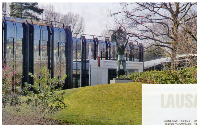
Олимпийский дом был открыт 12 октября 1986 г.

В декабре 1999 г. МОК вновь собрался в Лозанне на еще одну чрезвычайную сессию. Комиссия по реформам предложила 49 рекомендаций и установила лимит в 115 действующих членов МОК с возобновляемым сроком восемь лет пребывания в должности. Впервые члены Комиссии спортсменов стали полноправными членами МОК, и первые семь принесли присягу. Олимпийская клятва спортсменов тоже была модифицирована, включив упоминание