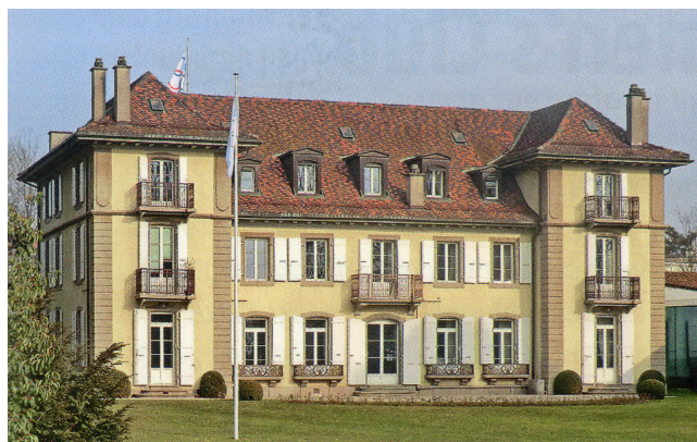
Город Лозанна открыл свободный доступ в Шато де Види для посещения публики в 1968 г., ранее там располагался Организационный Комитет Швейцарской национальной выставки 1964 г.