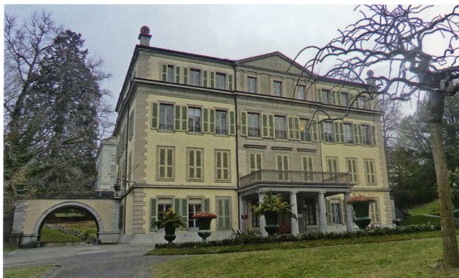
Вилла Мон-Репо – штаб-квартира МОК с 1922 по 1968 г. Ее история восходит к 1747 г., когда Генеральный контролер Абрахам Секретан выстроил здание на участке земли под названием Мон-Рибо