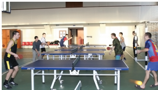
В распоряжении студентов Государственного университета физического воспитания и спорта Республики Молдова различные специализированные спортзалы, плавательный бассейн и другие спортивные объекты