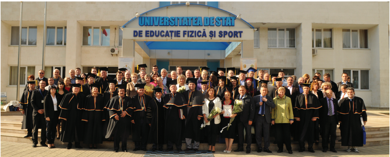
Груповой снимок участников международного научного конгресса «Спорт. Олимпизм. Здоровье» на фоне входа в главный корпус Государственного университета физического воспитания и спорта в Кишиневе

современным оборудованием цехам, ознакомили участников международного конгресса со всеми этапами технологических производственных процессов: от приемки различных сортов винограда, выращиваемого на окрестных виноградниках, которые расположены на склонах речной долины Днестра, обладающих уникальными природными условиями, – и до разлива готовых