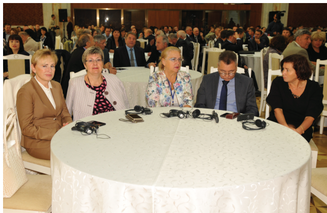
Торжественное открытие состоявшегося в Кишиневе конгресса «Спорт. Олимпизм. Здоровье» и его пленарные заседания проходили в большом зале Дворца Республики

дом «Допинг в олимпийском спорте: кризисные явления и пути их преодоления», проанализировал современную историю распространения допинга и борьбу Международного олимпийского комитета с этим негативным явлением, а также подверг обоснованной критике Всемирное антидопинговое агентство (WADA). Докладчик подчеркнул, что многолетняя деятельность этого агентства, несмотря на постоянно возрастающие его финансовые, юридические и кадровые возможности, интенсивную пропаганду, многократно возросшие объемы тестирований, жесточайшие санкции к нарушителям и поддержку WADA со стороны таких авторитетных международных организаций, как ООН, ЮНЕСКО, Совет Европы, не только не приблизила олимпийский спорт к решению допинговой проблемы, но и резко обострила ее, сделала опасной для авторитета и благополучия олимпийского движения. Причины этого – в принципиально ошибочной методологии, положенной Всемирным антидопинговым агентством в основу своей