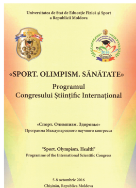
Обложка программы международного научного конгресса «Спорт. Олимпизм. Здоровье», состоявшегося 5-8 октября 2016 года в столице Республики Молдова Кишиневе