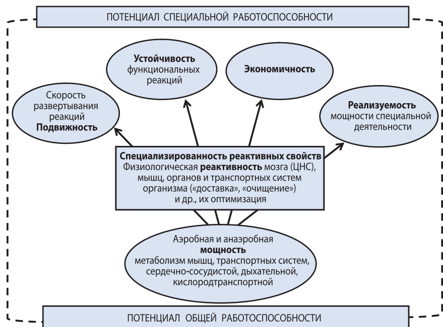
РИСУНОК 2 – Пути формирования специальной работоспособности спортсменов на основе специализированной модификации реактивных свойств ведущих для обеспечения работоспособности систем организма

Анализ научных исследований последних лет свидетельствует о том, что общее направление развития адаптации организма высококвалифицированных спортсменов к тренировочным и соревновательным нагрузкам разного характера прежде всего зависит от следующих свойств физиологиче-